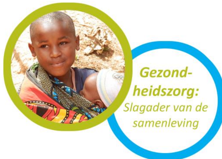
Global goal 3: